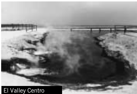
El Valley Centro

Bei allen Filmvorführungen ist der Eintritt frei – um Spenden wird gebeten