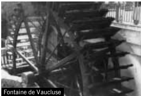
Fontaine de Vaucluse